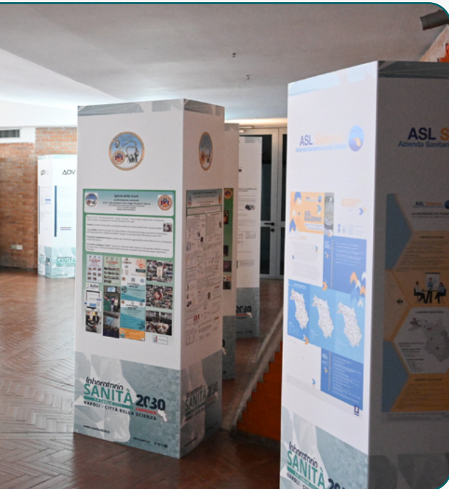
Poster Gallery Laboratorio Sanità 2022